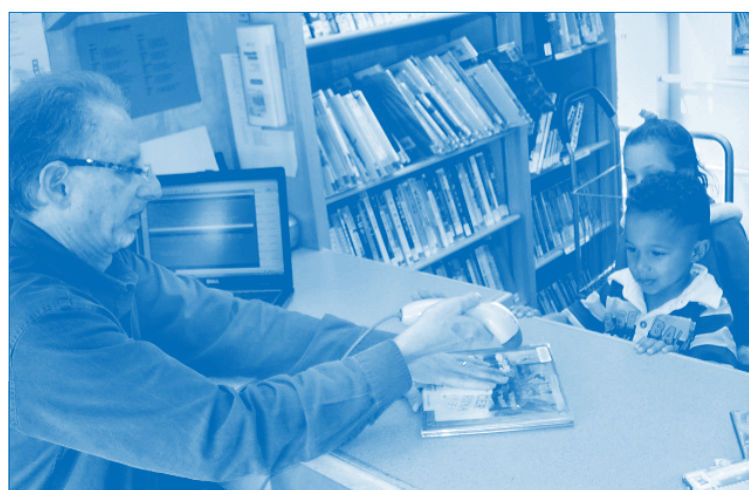
Un niño de Kidango Rix Center saca un libro en el mostrador del Bookmobile.