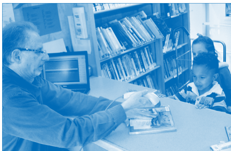
A child at Kidango's Rix Center checks out a book at the counter on the Bookmobile.

Children lined up with books in hand and teachers with book-filled baskets waited outside the large white Bookmobile excited to enter. As the children climbed up the stairs into the Bookmobile, they had bright smiles and chatted excitedly. They knew what was coming next because the Bookmobile visits the Kidango Rix site once a month.