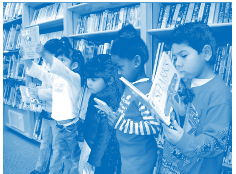
After storytime on the Bookmobile, children get to select their own books to check out. Above, children at Kidango's Rix Center sneak a peak at their new book selections as they wait in line to check out.

Written by: Leigh M. Corrigan-Owens Development & Communications Assistant Manager, Kidango