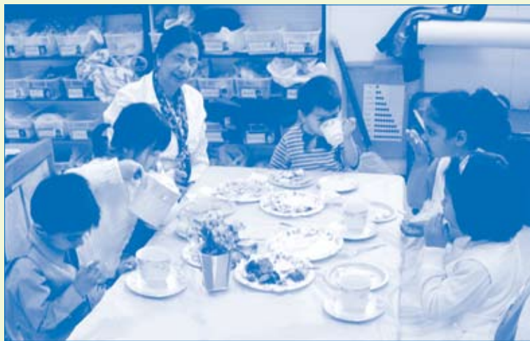
Children at Kidango's Alvarado Center, share a special pretend tea party to celebrate Week of the Young Child. Week of the Young Child is a special week to celebrate awareness of young children. Hosting a "tea" party helped emphasize what the children were already learning at Kidango about food, healthy eating, eating habits and table manners.

Early development of good eating habits is crucial. Children's early experiences with food will have an impact on their future health. Kidango provides breakfast, lunch and snacks prepared fresh daily from the Kidango kitchen. Providing nutritious meals and introducing new foods to children is the foundation of our nutrition education.